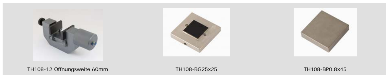
TH108-12 Öffnungsweite 60mm

Beispiele für weitere Ausführungen und kundenspezifische Anfertigungen