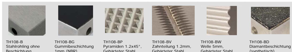
TH108-B Stahlrohling ohne Beschichtung